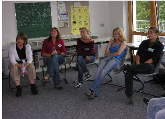
Workshop-Gruppe 1 beim Betrachten von Bildern und Austausch über Perspektiven

Frage: Was davon können wir auf die Arbeit der ups übertragen – Anti-Bias-Training, Interkulturelles Kompetenztraining/ Umwandlung einer Nord-Süd-Partnerschaft in eine Nord-Süd-Schulpartnerschaft, kritischer Umgang mit den Medien