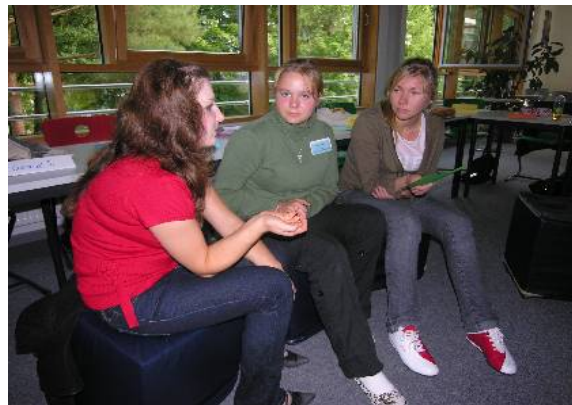
Intensive Gruppendiskussionen auch in Workshop 2

Die Inhalte und Methoden dieses Kurses zur Sensibilisierung und Entwicklung von interkultureller Kompetenz werden am zweiten Tag von den Gruppen für einem „Kulturkoffer“ zusammengestellt. Sie sollen für die Teilnehmenden aus den ups als Grundlage für die Arbeit mit Mitschüler/innen an den eigenen und / oder anderen Schulen dienen.