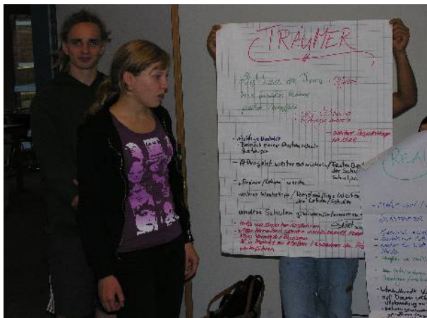
Präsentation der Workshop-Ergebnisse im Plenum

Am Ende der drei Seminartage kommen alle Workshopgruppen noch einmal zusammen. Sie berichten über ihre Arbeit und verständigen sich auf gemeinsame Ziele sowie Wünsche und Forderungen, die sich aus den Diskussionen in den Arbeitsgruppen ergeben.