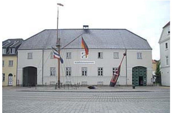
Rum-Museum im Flensburger Schiffahrtsmuseum

Die Fragen sollen Anregungen sein, um sich mit der wechselhaften Geschichte der Stadt Flensburg, den dort hergestellten Produkten, der besonderen Lage der Grenz- und Hafenstadt auseinander zusetzen. Ihre Beantwortung kann in Gruppen mit und ohne die Hilfe des Internets und anderer Informationsquellen erfolgen. Manche Fragen sind am Besten vor Ort zu klären, indem man mit Leuten spricht, die in den jeweiligen Bereichen kundig sind. Wenn Ihr solche Termine mit Fachleuten wahrnehmt, überlegt am Besten schon vorher, was Ihr fragen wollt.